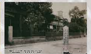
経営書・(長崎名所) 出島蘭館の趾 (長崎歴史文化博物館収蔵)