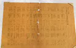
社団法人長崎内外倶楽部会員名簿