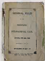
社団法人長崎内外倶楽部会則