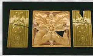
長崎内外倶楽部のタイル