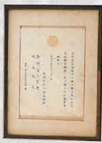
赤坂離宮御所宛送附会招待状